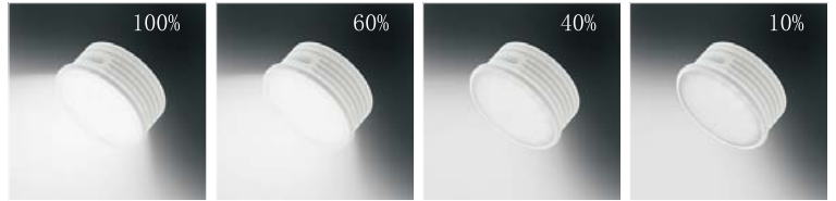
4-Stufen Dimmer/ 4-steps dimmer